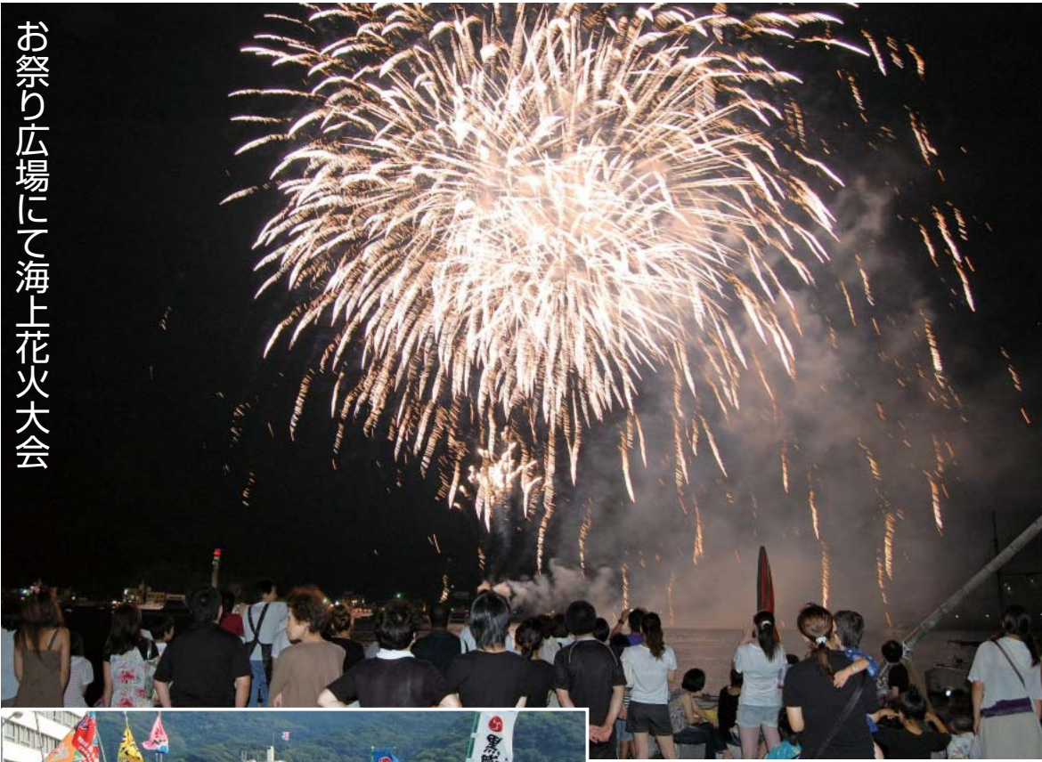
お祭り広場にて海上花火大会