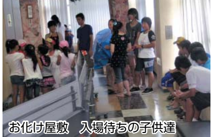
お化け屋敷 入場待ちの子供達