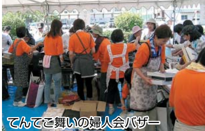
てんてこ舞いの婦人会バザー