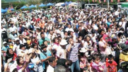
超混雑 投げもち大会