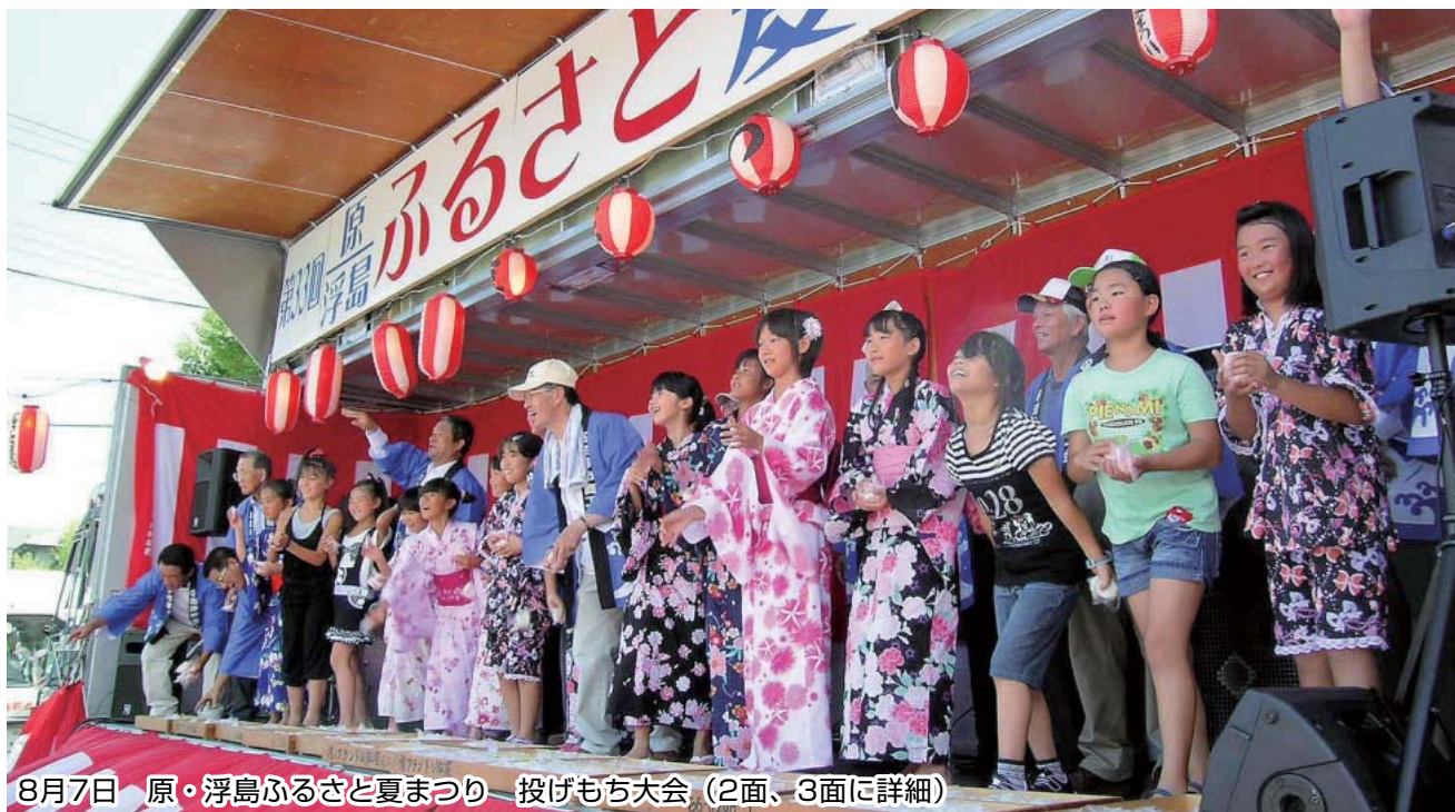
8月7日 原・浮島ふるさと夏まつり 投げもち大会 (2面、3面に詳細)

No. 30 発行者 沼津市商工会 会長 松永公良 〈本所・原支所〉沼津市原1200番地の1 TEL (055) 966-1331 FAX (055) 967-4925 〈戸田支所〉沼津市戸田1028番地の5 TEL (0558) 94-2224 FAX (0558) 94-4029 編集 沼津市商工会広報委員会