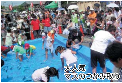
大人気 マスのかみ取り