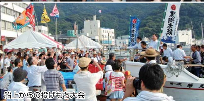
船上からの投げもち大会