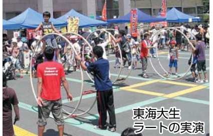
東海大生 ラートの実演