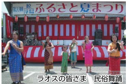
ラオスの皆さま 民俗舞踊