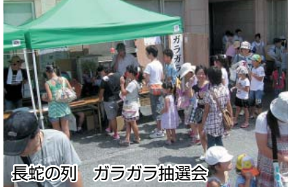
長蛇の列 ガラガラ抽選会