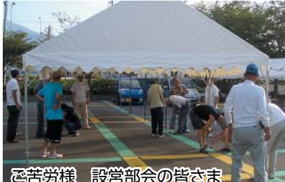
ご苦労様 設営部会の皆さま